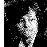
TENSIONE Proteste a Rende contro il ministro Carrozza (sopra)