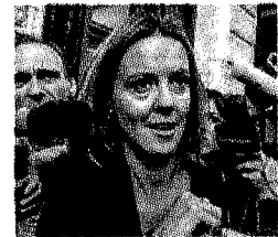
Il ministro Lorenzin

Valutato il parere degli esperti, il ministro della Salute Lorenzin blocca la sperimentazione