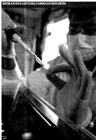
I lotti sospetti di vaccino erano destinati solo alle aziende sanitarie