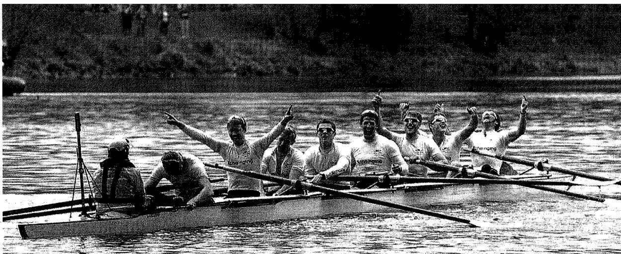
Esultanza L'equipaggio di Cambridge esulta dopo aver sconfitto Oxford il 3 aprile 2010: è il simbolo del vantaggio che Cambridge sta accumulando sui rivali

I premi Nobel formatisi all'università di Cambridge (vero e proprio record di vincitori) contro i 47 usciti da Oxford