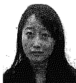
Il selfie I ragazzi di Associna, partner del Career Day