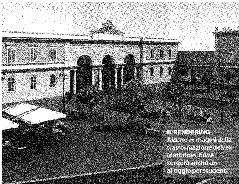
IL RENDERING Alcune immagini della trasformazione dell'ex Mattatoio, dove sorgerà anche un alloggio per studenti