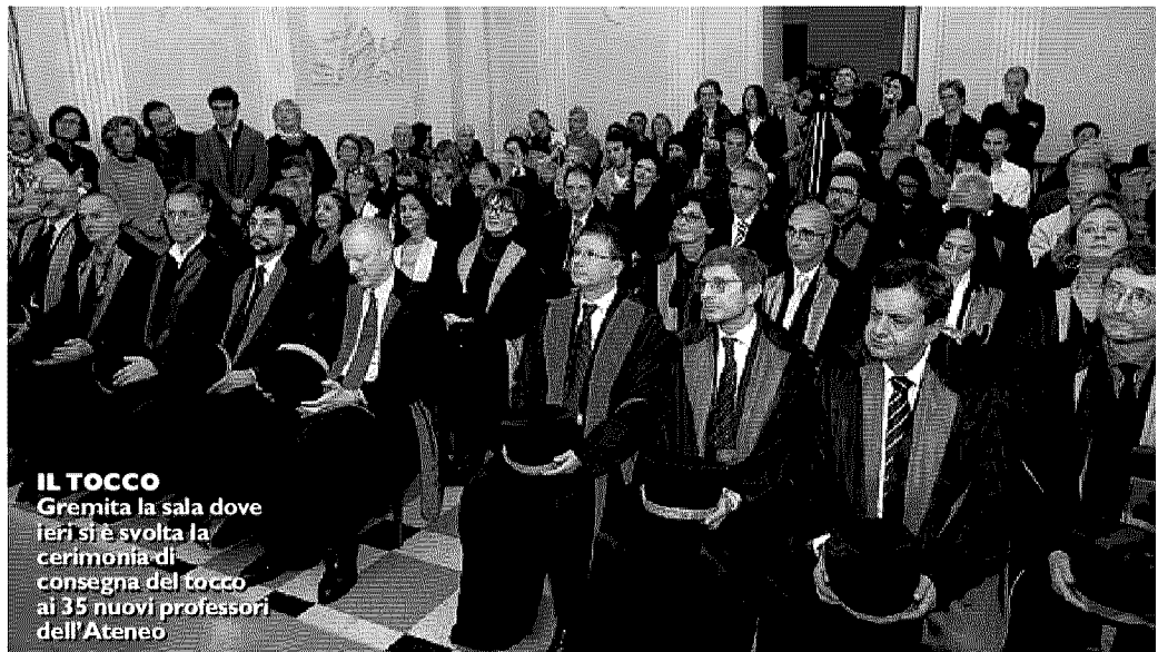
IL TOCCO Gremita la sala dove ieri si è svolta la cerimonia di consegna del tocco ai 35 nuovi professori dell'Ateneo