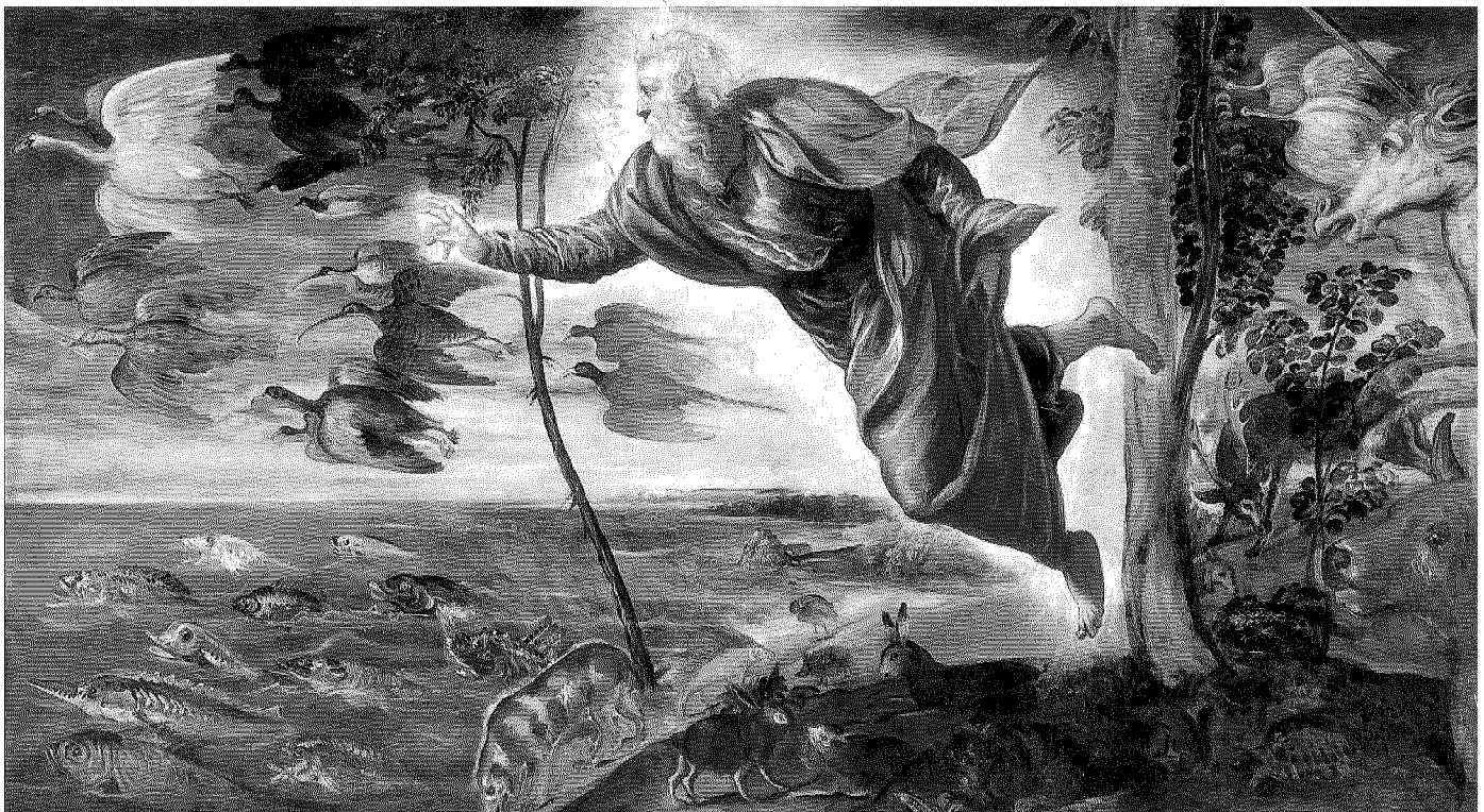
GENESI. La «Creazione degli animali» del Tintoretto (1519-1594), opera conservata nelle Gallerie dell'Accademia a Venezia