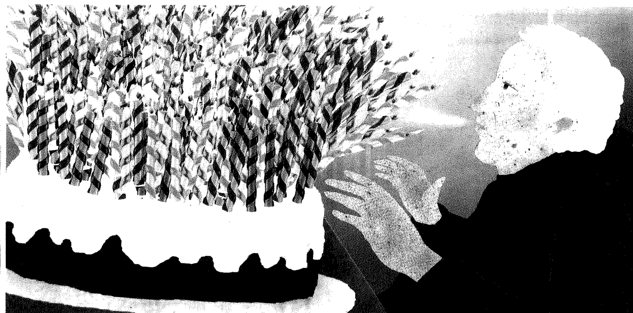
ILLUSTRAZIONE DI PAOLA FORMICA