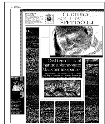
Gennaio 2015, i curdi festeggiano la sconfitta dell'Isis a Kobane