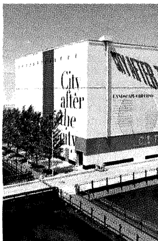
L'area ex Expo da poco riaperta