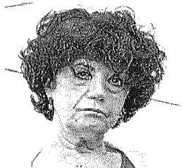
MASSI ■ A pagina 9