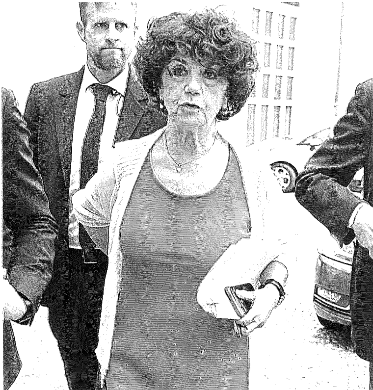
DICASTERO CHIAVE La ministra Valeria Fedeli

«C'è un dibattito in corso in Senato e si sta discutendo anche di questo, aspettiamo di vedere come andrà a finire».