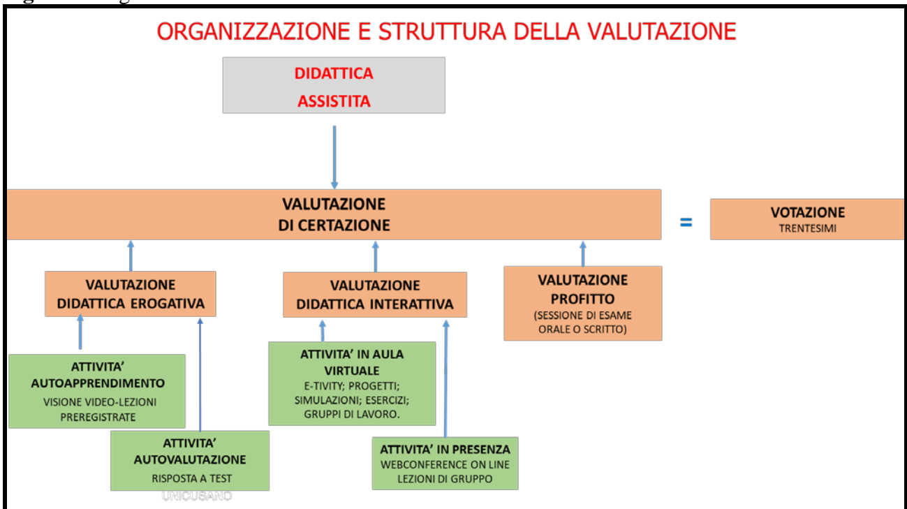
Figura 2. Organizzazione della valutazione e votazione.

La valutazione è registrata sulla base del sistema di verbalizzazione elettronica realizzato dall'università.